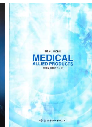
医療用製品ガイド